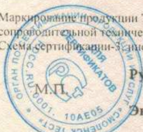
Схема сертификации - 3; инспекционный контроль - один раз в год.

Маркирование продукции Знаком соответствия производится по ГОСТ Р 50460-92 на шильдике изделия и в сопроводительной технической документации.