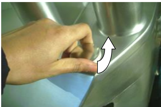
Открывание крышки (3)