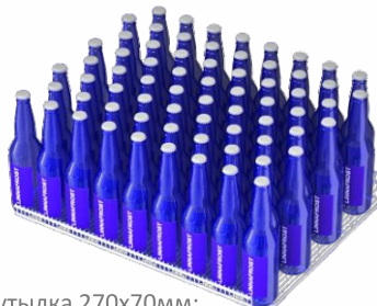
Размещение в шахматном порядке

Ст. бутылка 270x70мм: (9x4) + (8x4) x 5 = 340 шт. + дно (9x4)x1 = 36 шт. Максимальная загрузка 340 + 36 = 376 шт.