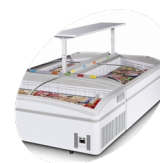
Установка островного типа, полки как принадлежности