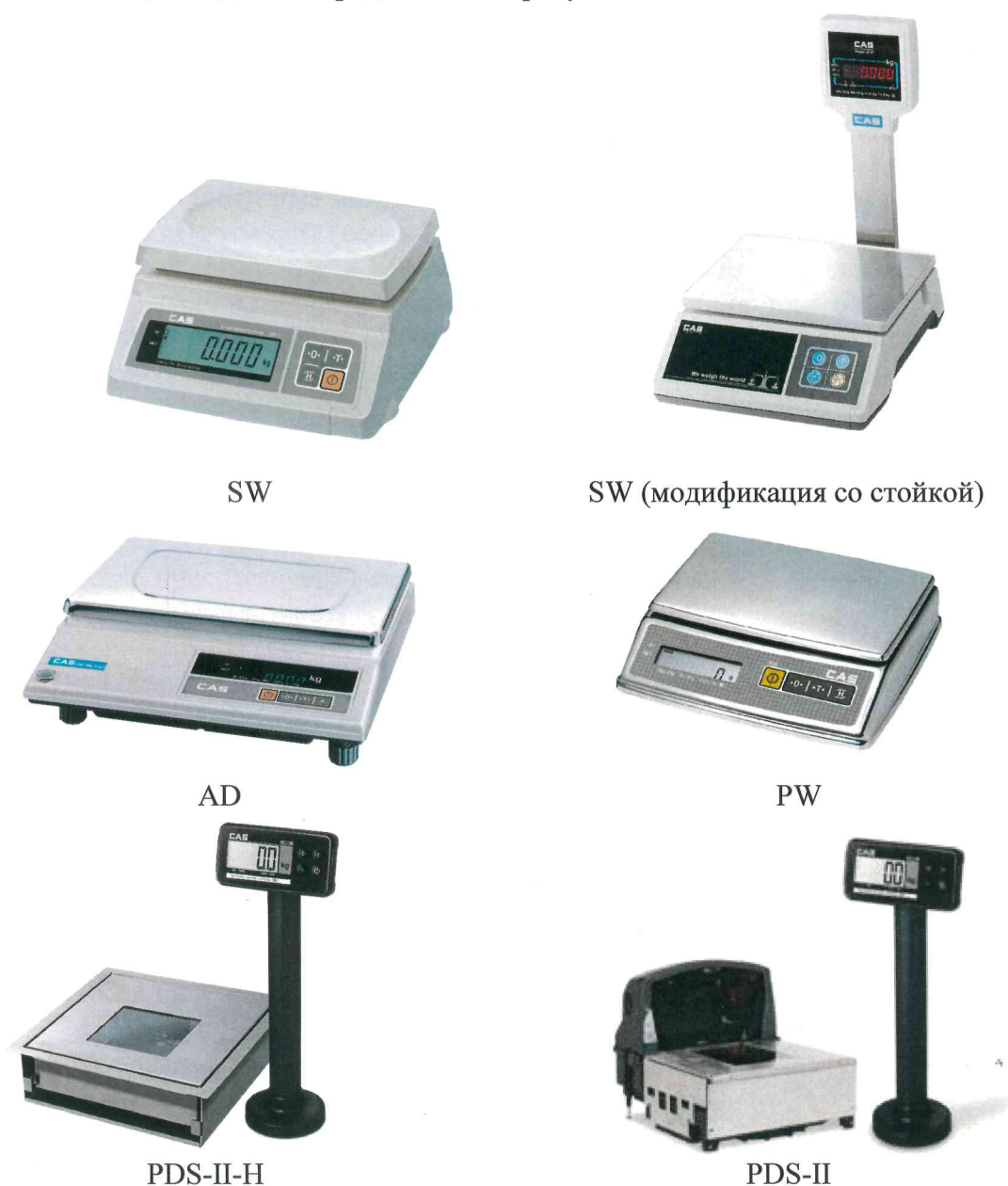
Рисунок 1 - Общий вид весов SW, PW, AD, PDS-II

Общий вид весов представлен на рисунке 1.